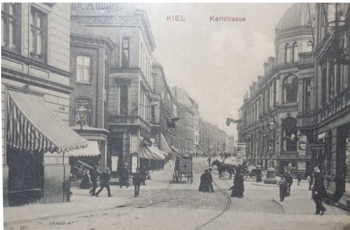
Aufnahme ausgestellt im Warleberger Hof, Kiel, Oktober 2007: „Die Hoffnung“ Ecke Karlstraße um 1905. Zur Orientierung: man blickt von der Muhliusstraße über die Brunswiker Str. in die Karlstr. hinein.