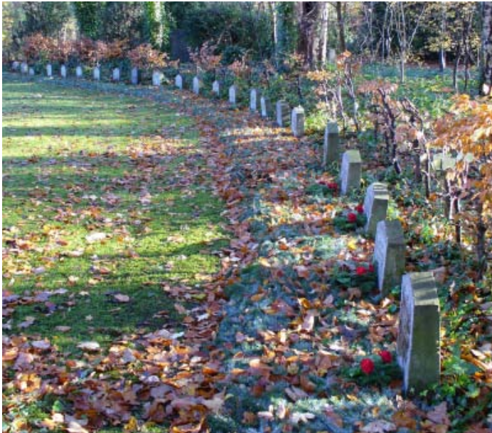
Gräber links vom Gedenkstein: 23

Rosenplänter beschreibt in seinem Aufsatz u.a., dass die Anlage in ihrer heutigen Form erst im Mai/Juni 1924 nach den Plänen eines der damals bedeutendsten Gartenarchitekten, Leberecht Migge entstand. Außerdem erläutert er, warum es den Nazis nicht gelang, die Anlage zu zerstören.