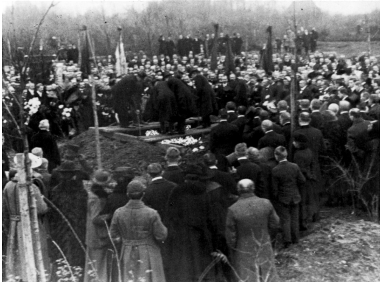
Foto rechts: Aufnahme von der Beerdigung am 10.11.1918

„... da gingen wir noch Seite an Seite. Euch hat's getroffen. Ihr starbt für die Freiheit. Ihr starbt für eine bessere Zeit. Hat sich euer Opfer gelohnt? Ist die Welt von heute eine friedliche Welt? Wir wollten die Gewalt beenden, wir wollten Frieden und Freundschaft unter den Menschen. Ihr alle auch ...“