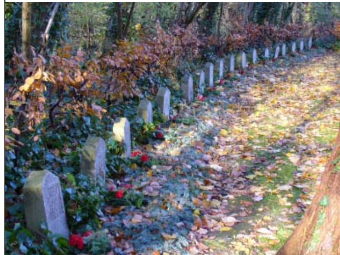
Gräber rechts vom Gedenkstein: 18